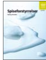
Cunto dhibsi IS-1470