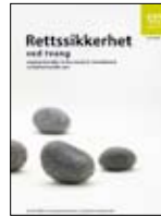
Kalsooni qaanuun IS-1467