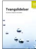
Xanuunka waswaaska IS-1469