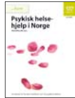
Caawimada caafimaadka nafsadda ee Norway laga helo Loogu talo galey dadka waaweyn , IS-1472 Loogu talo galey dhallinyarada, IS-1474 Ku saabsan carruurta, IS-1473