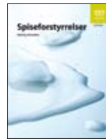
Cunto dhibsi IS-1470