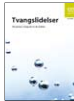
Xanuunka waswaaska IS-1469