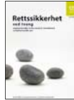
Yasal güvence IS-1467