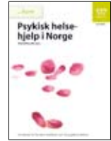
Norveç'de Ruh Sağlığı Yardımı • Yetişkinler için, IS-1472 • Gençler için, IS-1474 • Çocuklar hakkında, IS-1473