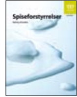
Yeme bozuklukları IS-1470