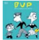
BUP • Çocuk, IS-1301 • Gençlik, IS-1302 • Yetişkinler, IS-1303

Broşürler www.psykisk.no web sayfasından Informasjonsmateriell bölümünden indirilebilir.