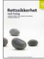
Yasal güvence IS-1467