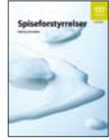
Yeme bozuklukları IS-1470