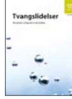
Saplantı - Zorlantı Bozukluđu IS-1469