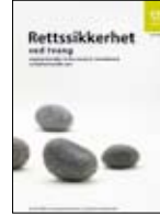
Yasal güvence IS-1467