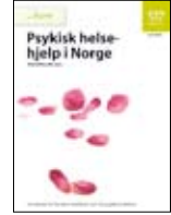
Norveç'de Ruh Sağlığı Yardımı • Yetişkinler için, IS-1472 • Gençler için, IS-1474 • Çocuklar hakkında, IS-1473