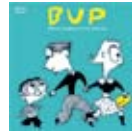
BUP • Çocuk, IS-1301 • Gençlik, IS-1302 • Yetişkinler, IS-1303

Broşürler www.psykisk.no web sayfasından Informasjonsmateriell bölümünden indirilebilir.