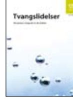
Saplantı - Zorlantı Bozukluğu IS-1469